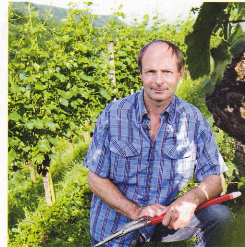
Blauburgunder aus dem Rheinbogen: Pircher.